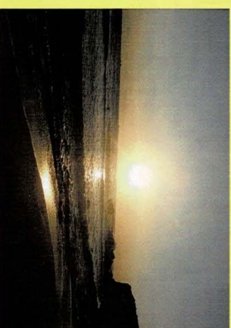
補整前のオリジナル画像データ ↓