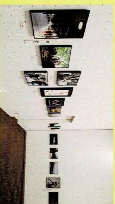
写真展のイメージ